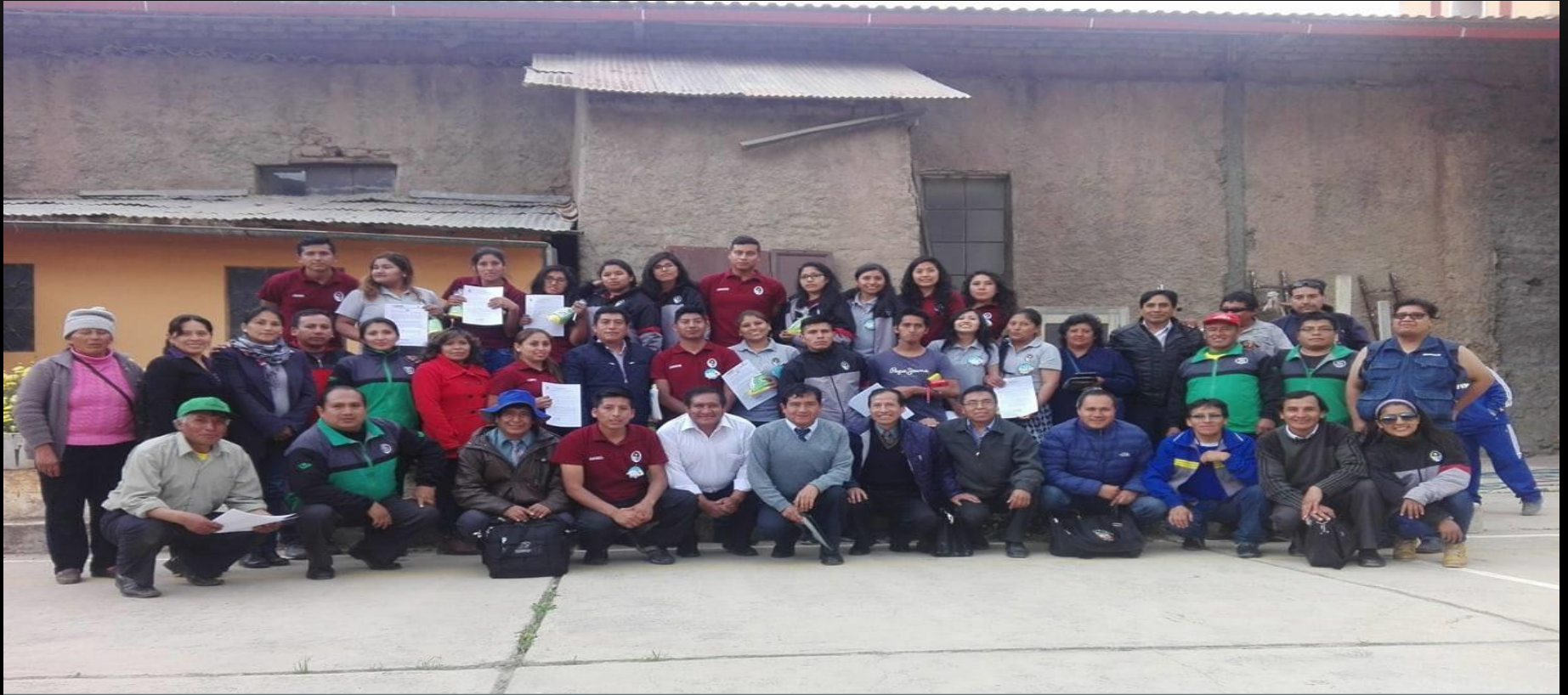
CLAUSURA DEL SEMINARIO DE ACTUALIZACION CONTINUA PROYECTO DEJADO AL ALCALDE DEL DISTRITO UNIDOS AUTORIDADES EDILES, COMUNIDAD, DIRECTORES Y DOCENTES DE LAS INSTITUCIONES EDUCATIVAS Y LOS ESTUDIANTES DE LA PRACTICA EQUIPO 21